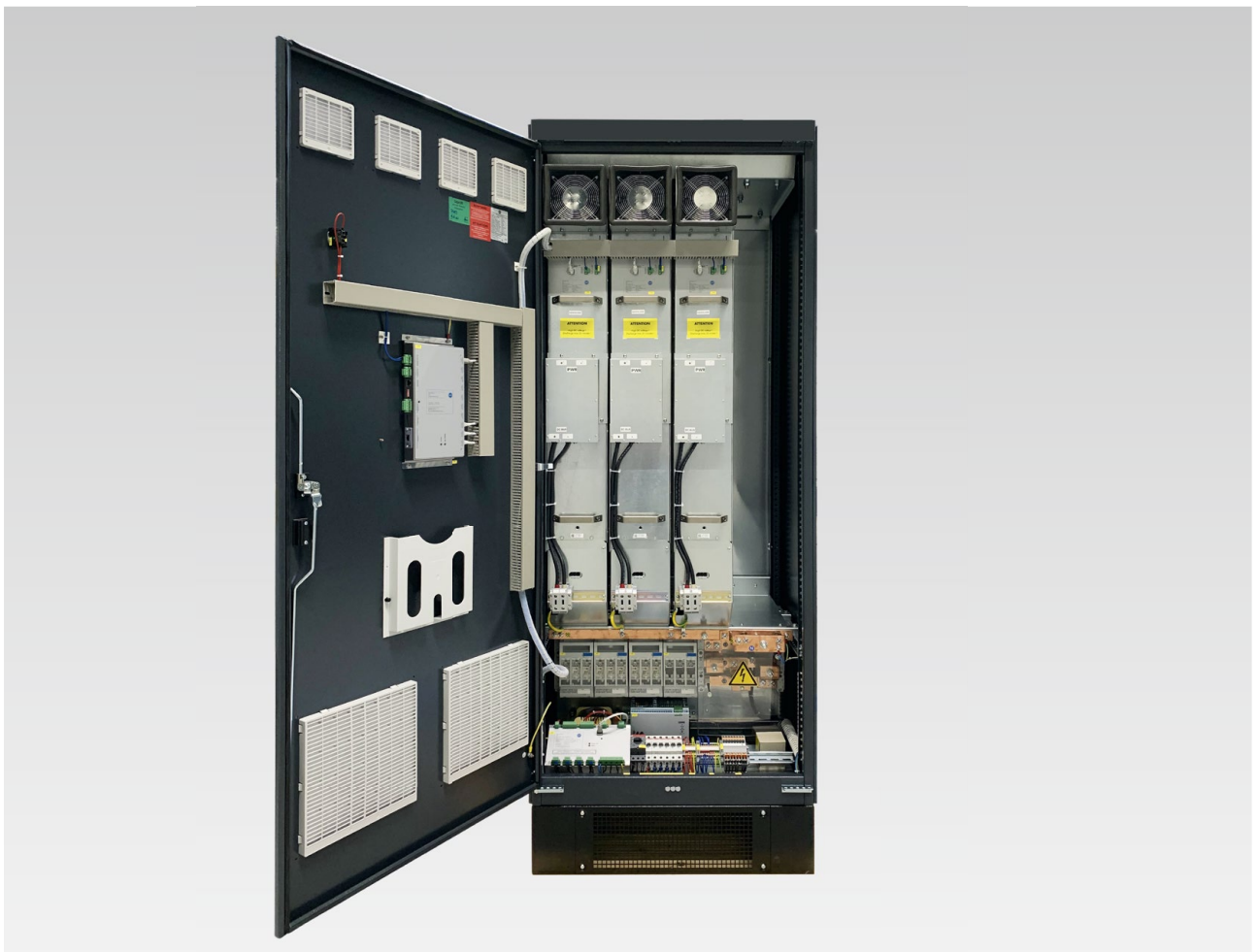
TESVOLT PCS mit drei Wechselrichtermodulen (IPU)