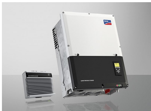
SMA Sunny Tripower Storage 60 avec SMA Inverter Manager